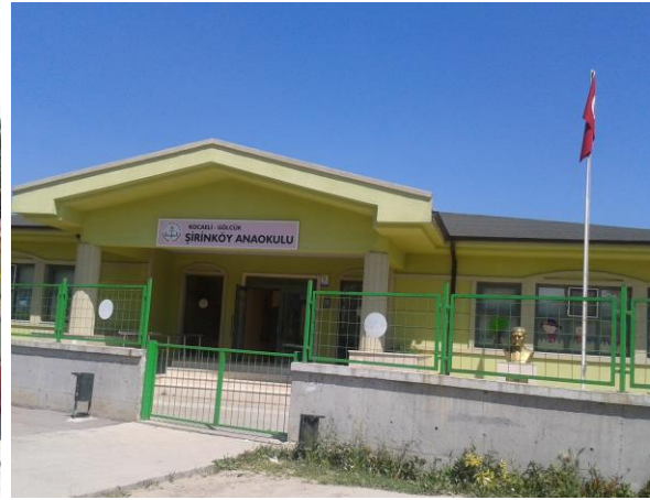
YENİ BİNA 2009...